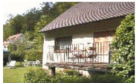
Ferienwohnung „Haus Eliese“ ideal für Familien mit Kindern!

Heute zeichnet zeitgemäßer Komfort und eine gemütliche Atmosphäre dieses Haus aus.